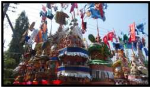
Gambar 3 Gunung

Hari ketiga sebagai puncak acara dilakukan penyambutan Thay Su yaitu penyambutan Raja Yanluo (Hanzi) atau Giam Lo Ong (Hokian). Selanjutnya dilakukan sembahyang bersama sebanyak tiga putaran yaitu putaran pertama untuk Tian (Tuhan), putaran kedua untuk Di atau bumi, dan ketiga untuk Ren atau alam. Pada puncak acara sudah tersedia 39 gunung (Jian) yang nantinya setelah sembahyang selesai untuk diperebutkan oleh masyarakat sekitar. Gunung atau dalam disebut juga manganan merupakan sumbangan dari berbagai umat yang dipercaya membawa keberkahan apabila berhasil memperolehnya setelah didoakan dalam ritual ini.