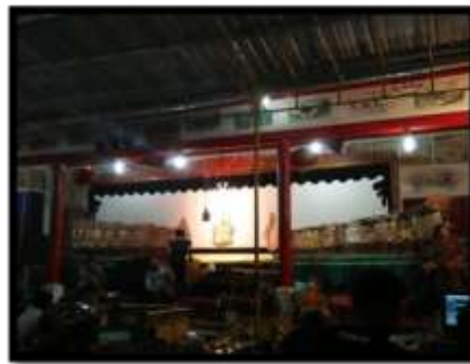
Gambar 1 Pergelaran wayang kulit dalam ritual King Ho Ping

Rangkaian ritual King Ho Ping di kelenteng Hok Swie Bio Bojonegoro diawali dengan pergelaran wayang kulit. Dipilihnya pergelaran ini sebagai wujud perpaduan budaya Tionghoa dengan budaya lokal Indonesia. Bagi masyarakat Jawa, wayang kulit merupakan bagian yang tidak terpisahkan dalam ritual sedekah bumi. Perpaduan dua budaya inilah yang merupakan keunikan dari ritual ini di kelenteng ini. Pergelaran wayang kulit ini terbuka untuk dinikmati masyarakat umum tidak hanya untuk umat Tri Dharma saja.