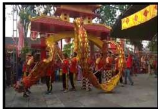
Gambar 2 atraksi Liong da Barongsai

Hari kedua setelah pergelaran wayang kulit dilanjutkan karawitan yaitu kesenian berupa lagu-lagu jawa yang dinyanyikan oleh sinden. Setelah karawitan dilanjutkan atraksi Liong dan Barongsai yang merupakan ritual untuk mengusir roh jahat. Pada atraksi ini dimainkan oleh pemuda-pemuda dari masyarakat sekitar kelenteng. Meskipun bukan bagian dari umat, namun masyarakat sekitar turut serta dalam ritual. Pada malam hari dilanjutkan malam kesenian dan lelang dan ditutup dengan sembahyang ditengah malam.