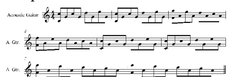
Notasi 7 Musik Romantis.

Musik romantis di atas menggunakan tangga nada mayor dan memiliki pola ritme yang sama dari awal hingga akhir. Musik romantis akan terasa sangat muncul ketika didukung dengan adegan. Musik tersebut terdapat dalam pementasan teater kembang dengan lakon keduwuren, adegan ketika pak soib dan bu imah sedang bermesra-mesraan di ruang tamu.