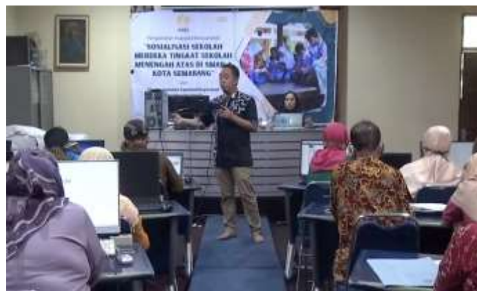
Gambar 1. Pelaksanaan Kegiatan

Hasil projek ketiga kelompok tersebut nantinya akan ditampilkan di pagelaran pasar rakyat SMA N 8 Semarang. Kegiatan penguatan yang dilakukan dalam fase ini, bukanlah menyusun perangkat pembelajaran dan rencana pelaksanaan P5 dari awal. Akan tetapi, penguatan dalam hal ini adalah dengan mendiskusikan dengan narasumber mengenai modul ajar dan rencana projek P5 yang disusun pada kegiatan sebelumnya. Tujuan yang ingin diraih adalah mendapatkan komentar dan perspektif dari narasumber kegiatan pengabdian ini mengenai perencanaan yang telah dibuat tersebut, sekaligus agar guru lebih mantap untuk melaksanakan kegiatan pembelajaran baik klasikal maupun projek tersebut.