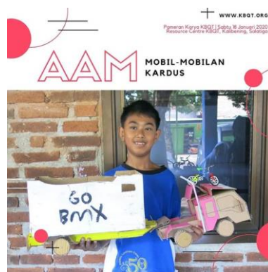
Gambar 2. Karya Warga Belajar (Sumber: Data Sekunder 2020)

Proses belajar konstruktivisme dalam komunitas ini dilakukan dengan mengarahkan warga belajar untuk dapat membangun pengetahuannya secara aktif, sedikit demi sedikit, dan mandiri. Dengan menggunakan proses belajar konstruktivisme, harapannya warga belajar mendapatkan pemahaman pengetahuannya sendiri secara utuh agar dapat mandiri dan bertanggung jawab atas proses belajarnya. Hal ini selaras dengan Atmajda (2015: 86) bahwa internalisasi sangat penting, mengingat gagasan paradigma konstruktivisme bahwa pengetahuan dalam pikiran mengontruksi tindakan manusia. Kebiasaan bisa melahirkan dorongan internal untuk melaksanakan suatu tindakan sosial atas perintah alam bawah sadar, sehingga bersifat otomatis. Senada dengan hal tersebut, proses penanaman kesadaran belajar dalam komunitas ini merupakan hal yang penting bagi warga belajar, ini dilakukan komunitas sebagai upaya untuk mengarahkan aktivitas belajar pengembangan potensi diri warga belajar.