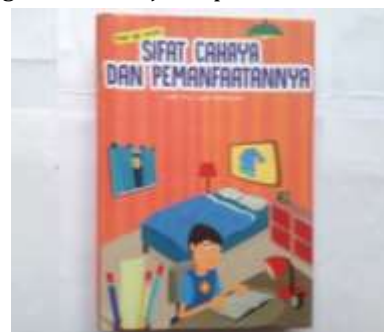
Gambar 2. Produk Akhir.

pembelajaran materi Sifat Cahaya. Produk akhir sebagaimana disajikan pada Gambar 2.