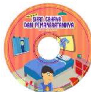
Gambar 3. CD yang Memuat Video Tampilan Modul.

Produk tersebut didokumentasikan dalam bentuk video dan disajikan kedalam suatu Compact Disk sebagaimana pada Gambar 3.