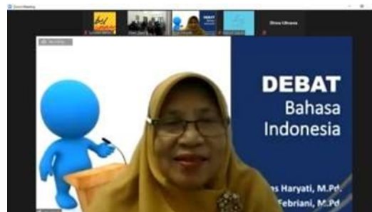
Foto 1. Pengabdi memberikan materi 1