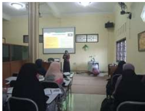
Foto 2. Pengabdi memberi pengarahan simulasi debat

Materi ini berfokus pada kegiatan teknis debat, diskusi dan evaluasi pelaksanaan debat nasional dari guru Bahasa Indonesia. Kegiatan tersebut kemudian dilanjutkan dengan simulasi debat.