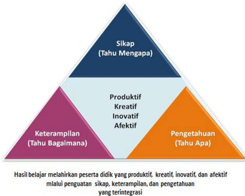
Gambar 1. Proses Pembelajaran dengan Pendekatan Saintifik

Metode ilmiah merujuk pada teknik-teknik investigasi atas fenomena atau gejala, memperoleh pengetahuan baru, atau mengoreksi dan memadukan pengetahuan sebelumnya. Untuk dapat disebut ilmiah, metode pencarian (method of inquiry) harus berbasis pada bukti-bukti dari objek yang dapat diobservasi, empiris, dan terukur dengan prinsip-prinsip penalaran yang spesifik. Karena itu, metode ilmiah umumnya memuat serial aktivitas pengoleksian data melalui observasi dan eksperimen, kemudian memformulasi dan menguji hipotesis.