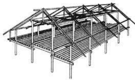
Gambar 1. Kerangka Bagunan Rumah Tradisional Aceh

Rumah tradisional Aceh adalah rumah kayu berbentuk rumah panggung yang dapat dibongkar pasang sehingga mudah dipindahkan ke tempat lain. Menurut Meutia (dalam Yusuf, 2015) Rumah tradisional Aceh didirikan di atas tiang-tiang bulat yang diletakkan di atas pondasi batu. Setiap bagian-bagian pembentuk rumah tradisional Aceh dihubungkan dengan sambungan menerus yang diperkuat dengan pasak dan ikatan tali ijuk . Masing-masing bagian rumah tradisional Aceh saling mendukung untuk mempertahankan konstruksinya terhadap goncangan gempa yang terjadi. Oleh karna itu rumah tradisional Aceh memiliki keunggulan secara struktur dalam merespon gempa.