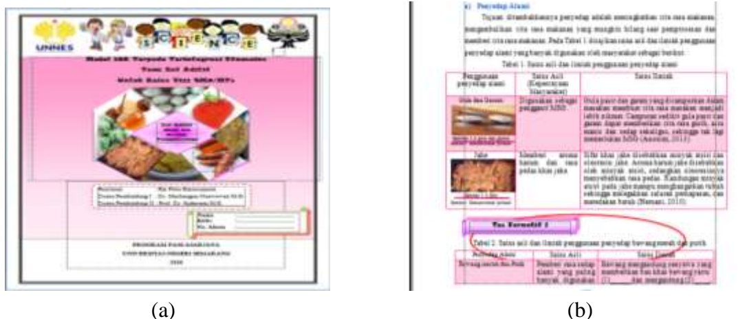
Gambar 1 (a) cover modul setelah direvisi (b) materi modul setelah direvisi disesuaikan dengan kehidupan sehari-hari siswa dan terdapat evaluasi setiap sub bab pokok bahasan

Modul yang sudah layak menurut ahli selanjutnya di uji cobakan pada uji coba keterbacaan modul. Uji coba keterbacaan modul dilakukan dengan jumlah terbatas. Uji coba keterbacaan modul ini dilakukan pada kelas VIII B dengan jumlah 10 siswa. Uji coba keterbacaan modul bertujuan mengetahui kesiapan modul sebelum digunakan pada kelas penerapan modul. Berdasarkan hasil angket keterbacaan siswa terhadap modul IPA terpadu terintegrasi etnosains mendapat respon positif dari siswa.