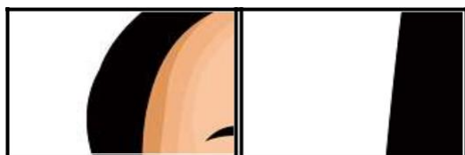
Gambar 4. Kepingan puzzle sisi potongan gambar