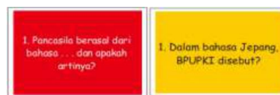
Gambar 2. Kartu Soal