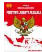
Gambar 1. Cover Media

Selanjutnya peneliti melakukan kajian literatur dan mengumpulkan sumber yang berkaitan dengan materi peristiwa lahirnya Pancasila. Pengembangan desain diawali dengan menyusun komponen media puzzle berbasis index card match yang meliputi kepingan puzzle dua sisi (sisi jawaban dan sisi potongan gambar), kartu soal, cover media puzzle (gambar dan teks materi), petunjuk permainan, bingkai dan papan bernomor untuk menempatkan jawaban, dan kotak puzzle untuk menyatukan seluruh komponen yang ada, sehingga hasil akhirnya berupa desain produk baru. Berikut ini adalah hasil pengembangan media puzzle berbasis index card match