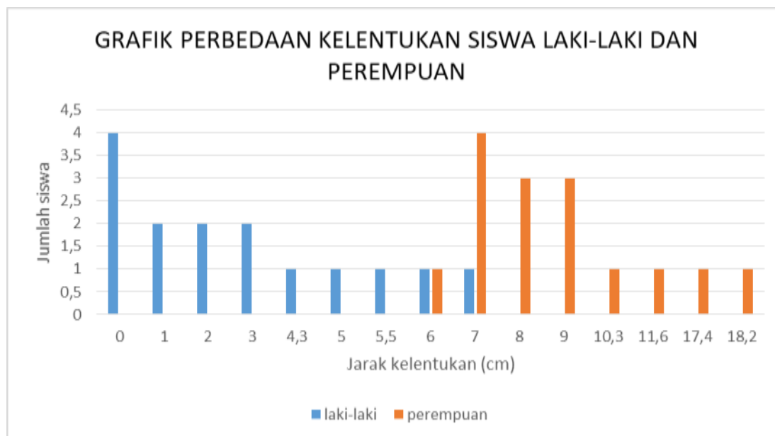
Gambar 2. Histogram perbedaan kelentukan siswa laki laki dan perempuan SMP Negeri 1 Bangkalan

Berikut adalah grafik ilustrasi Perbedaan Kelentukan Siswa laki laki dan perempuan di SMP Negeri 1 Bangkalan