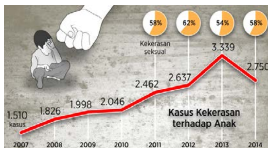
Gambar 2. Data kekerasan terhadap anak tahun 2007-2014