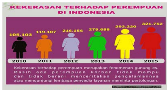
Gambar 1. Kekerasan Terhadap Perempuan Di Indonesia Tahun 2010-2015

Pendidikan karakter merupakan hal yang penting untuk segera dilaksanakan karena degradasi moral semakin lama semakin meningkat. Sebagai contoh meningkatnya degradasi moral adalah sebagai berikut :