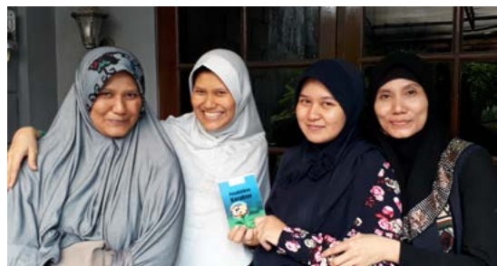
Gambar 5. Pembagian Buku Saku melalui Dawis