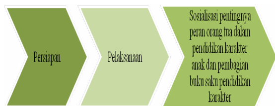
Gambar 1. Tahapan Pengabdian

Pengabdian ini ingin menghadirkan solusi kepada masyarakat khususnya keluarga untuk ikut aktif berperan dalam menumbuhkembangkan karakter anak mengiangat degradasi moral makin lama makin meningkat dan bermunculan dengan berbagai wujud berbeda. Pengabdian ini dilaksanakan selama 6 bulan mulai bulan Mei-Oktober 2018. Pengabdian yang akan dilakukan meliputi tahapan sebagai berikut: