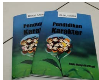
Gambar 2. Buku Saku Pendidikan Karakter

Pembuatan Buku Saku Pendidikan karakter ini merupakan kerjasama antara pengabdian dengan P3KB dan Padepokan Karakter.