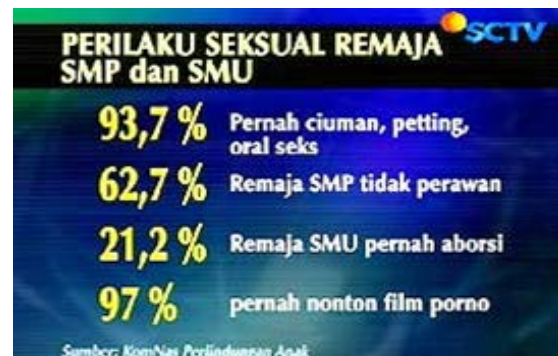
Gambar 3. Perilaku Seksual Remaja SMP dan SMU

Jika pendidikan merupakan usaha sadar yang terencana untuk membentuk kualitas manusia sesuai dengan apa yang diharapkan yang mengacu kepada tiga lingkungan yaitu keluarga, sekolah dan masyarakat maka, yang utama harus segera dibenahi adalah pendidikan di lingkungan keluarga. Pendidikan pertama dan utama adalah keluarga hal ini sejalan dengan pendapat Slameto (2003) yang mengatakan bahwa keluarga adalah lembaga pendidikan yang pertama dan utama bagi anak-anaknya, baik pendidikan bangsa, dunia, dan negara sehingga, cara orang tua mendidik anak-anaknya akan berpengaruh terhadap belajar. Dalam teori struktural fungsional disebutkan bahwa family is the basic unit of society . Jadi apabila institusi keluarga dalam