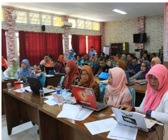
Gambar 1. Seminar Pendidikan Karakter bagi guru-guru di Gunungpati