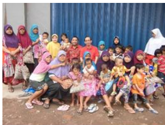
Gambar 2. Anak Jalanan dan Keluarganya

Penyusunan rencana teknis pelatihan mulai dari memberikan motivasi, membuat teknis konsep pelatihan, hingga pembelian alat dan bahan yang dibutuhkan saat pelatihan. Pembentukan paradigma dan motivasi ini diberikan pada setiap pertemuan dan juga pada akhir program sekaligus sebagai pengenalan kepada para anak jalanan di Rumah Pintar Matahari akan nilai-nilai kehidupan dan refleksi dari setiap game-game yang sudah dilakukan. Pengenalan dan penjelasan mengenai seperti apa kegiatan IbM ini dilakukan di awal pertemuan.