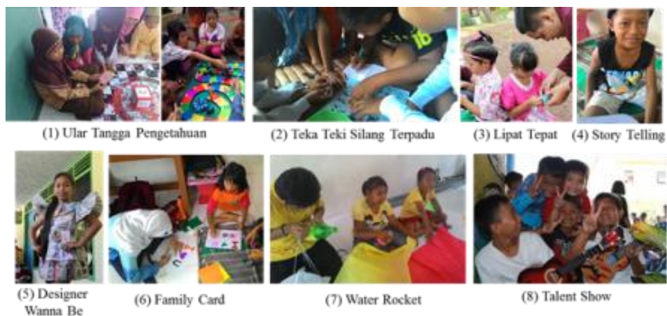
Gambar 8. Pelaksanaan Keterampilan Interpersonal

Pada setiap jenis permainan anak-anak jalanan dibagi menjadi beberapa kelompok dengan didampingi oleh kakak-kakak pendamping untuk setiap kelompoknya yang bertugas untuk memantau dan membantu anak-anak yang mendapati kesulitan. Game ular tangga pengetahuan dan teka-teki silang diarahkan agar anak jalanan mengetahui dan mengenali pengetahuan umum penting terkait dengan negara Indonesia dan juga untuk menumbuhkan nasionalisme di dalam diri anak-anak. Game lipat tepat dan family card bertujuan untuk mempelajari bagaimana cara kita menyampaikan perintah kepada orang lain sesuai dengan apa yang kita inginkan. Untuk menumbuhkan kepercayaan diri anak jalanan dilatih dalam game story telling , designer wanna be , dan talent show . Sedangkan game water rocket dapat melatih kerja sama diantara anak jalanan.