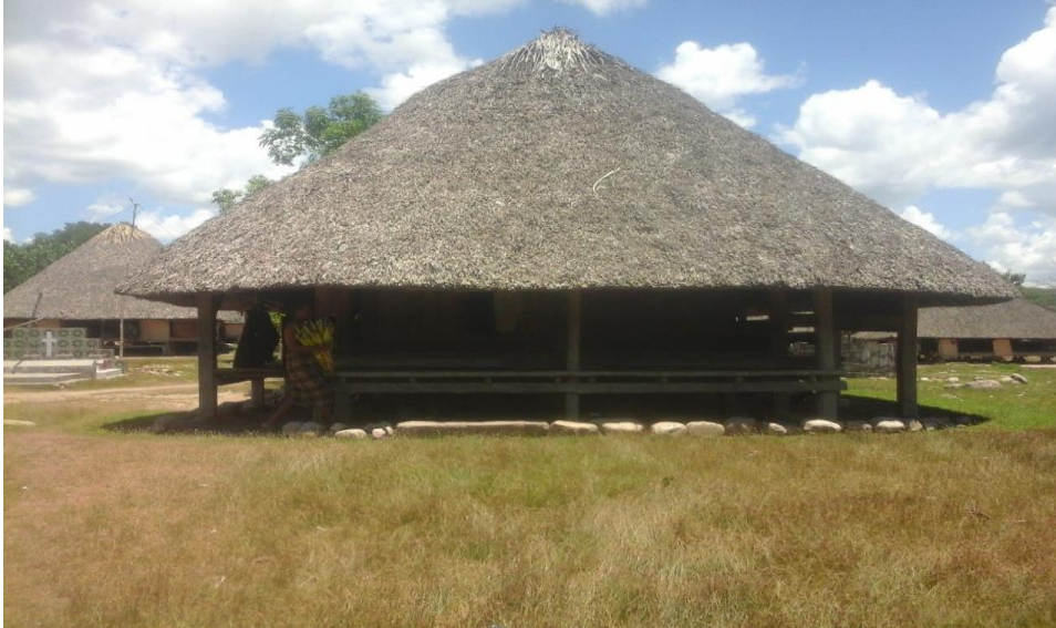
Gambar. 1 Hubungan Bentuk Etnomatematika Kebudayaan Malaka dengan konsep segitiga dan persegi