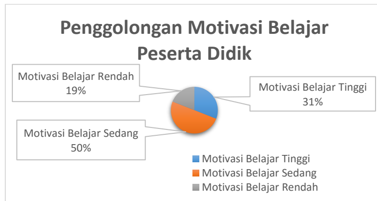
Gambar 2. Penggolongan motivasi peserta didik