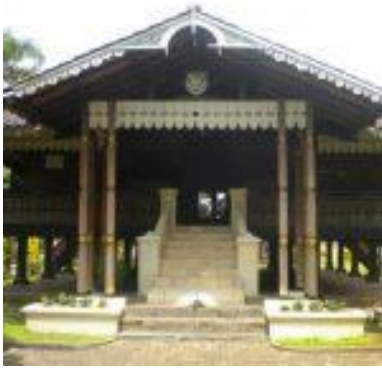
Gambar 1. Rumah Adat Bubungan Lima