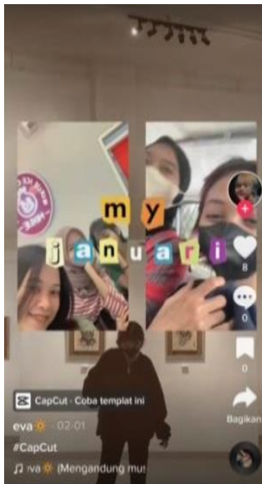
Gambar 6. Informan Memposting Konten Mount Dump

Perilaku imitasi dalam bentuk isi konten yang sama juga terlihat pada pembuatan video " mounth dump ". Mounth Dump merupakan sekumpulan data-data atau rewind momen berupa rekap foto atau kenangan yang dilalui selama satu bulan. Trend ini akan ramai muncul di halaman FYP saat pergantian bulan. Mahasiswa FIS UNNES akan berloma-lomba untuk membuat konten mount dump untuk dibagikan ke laman media sosial.