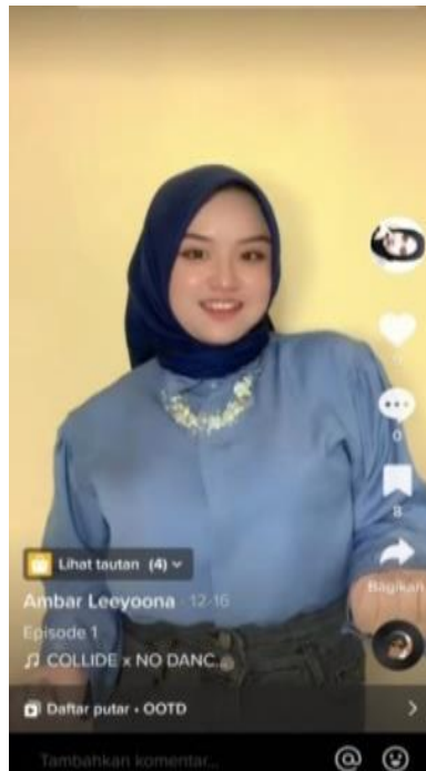
Gambar 9. Content Creator Membagikan Rekomendasi Outfit

Penampilan pada konten TikTok meliputi atribut atau pemilihan pakaian dan aksesoris, serta make up yang akan ditampilkan. Pemilihan pakaian atau atribut disesuaikan dengan ketertarikan viewers mengenai gaya berpakaian yang sedang trend . Performa atau penampilan di dalam konten TikTok dapat meningkatkan kredibilitas sehingga dapat meningkatkan jumlah pengikut, dan mendorong orang lain untuk berinteraksi dengan konten tersebut.