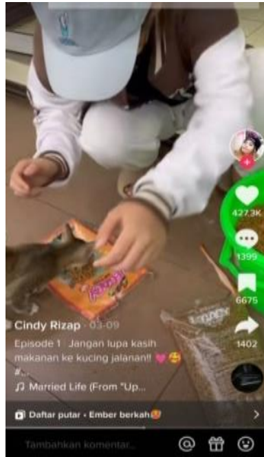
Gambar 7. Tokoh idola sedang memberi makan kucing jalanan

Habit mencakup perilaku, kebiasaan dan preferensi seorang konten kreator yang ditunjukkan melalui sebuah video. Pengguna TikTok seringkali berusaha untuk menunjukkan kehidupan yang ideal dan menginspirasi pengikut untuk mengikuti pola hidup yang sama. Konten kreator TikTok seringkali membagikan aktivitas atau kebiasaan untuk diakses publik salah satunya konten tentang kepedulian terhadap sesama makhluk hidup.