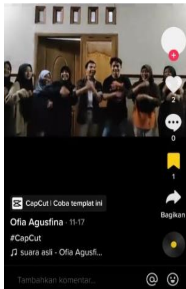
Gambar 10. Konten Informan Menggunakan Aplikasi Capcut

Peniruan dalam proses editing mahasiswa FIS UNNES pada media sosial TikTok memanfaatkan aplikasi tambahan yaitu aplikasi capcut dengan konten jedag-jedug. Istilah jedag-jedug dipopulerkan oleh pengguna TikTok untuk menggambarkan video yang menampilkan pengguna TikTok melakukan gerakan-gerakan maupun rangkaian foto sesuai dengan irama musik atau efek suara tertentu. Dalam konteks TikTok. Konten jedag-jedug ini merupakan bentuk imitasi dengan tujuan memperindah dan menarik perhatian viewers dengan berbagai macam lagu-lagu yang di remix sedemikian rupa.