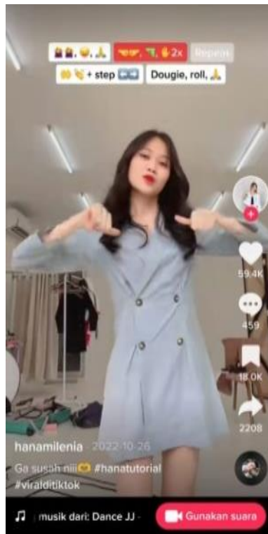
Gambar 5. Tutorial Dance

Media sosial TikTok dikenal pertama kali sebagai media sosial yang banyak menyuguhkan berbagai konten berjoget atau dance , bahkan seringkali dijumpai video kreator TikTok yang mengaja membagikan tata cara atau tutorial gerakan-gerakan dance TikTok yang sedang viral/ramai diikuti oleh pengguna lainnya.