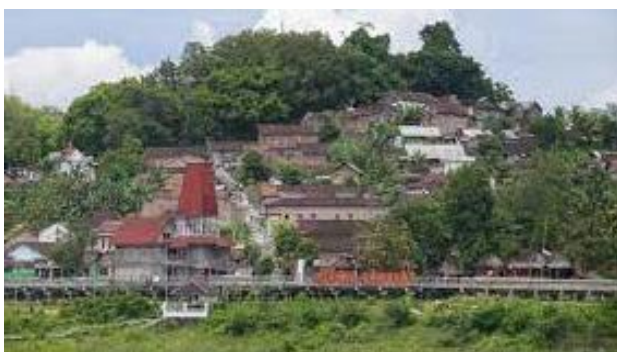
Gambar 1. Gunung Kemukus

Gunung Kemukus di Kabupaten Sragen menyimpan misteri yang kontroversi. Sebuah kontroversi yang benar-benar sulit ditarik benang merah pembatas antara pangiwa dan panengen atau benar dan salah dalam penafsiran. Tidak lepas dari perjalanan Pangeran Samudro dalam mengemban tugas dari raja Demak untuk menyatukan saudara-saudara se-ayah (Brawijaya V), yang telah tercerai berai setelah terjadi perang keling/Girindha Wardana dan mengemban misi mengembangkan agama Islam. Nama Gunung Kemukus diambil oleh para tetua, pemuka dan tokoh masyarakat sekitar gunung itu karena sebuah sebab, yaitu di atas bukit ada suatu sudut yang berbentuk kukusan (alat penanak nasi). Tempat itu akhirnya menjadi tempat peristirahatan terakhir Pangeran Samudro dalam perjalanan mengemban tugasnya. Di bawah ini adalah gambar dokumentasi Gunung kemukus.