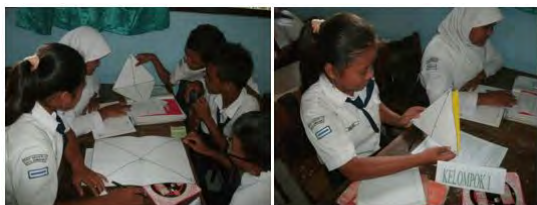
Gambar 3. Kegiatan pada kelas eksperimen I

Oleh karena itu, model pembelajaran MMP merupakan salah satu model pembelajaran yang cocok digunakan untuk memberikan pengalaman belajar yang ditunjang berbagai latihan sehingga peserta didik tersebut dapat lebih terlatih dan pengetahuan yang peserta didik dapatkan akan lebih melekat pada pikiran peserta didik. Hal ini dapat mempermudah peserta didik dalam memahami materi yang dipelajari.