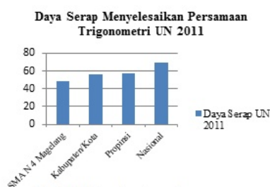
Grafik 1 Menyelesaikan Persamaan Trigonometri Daya Serap UN 2011

Materi trigonometri merupakan materi pokok pelajaran matematika kelas X pada semester genap. Materi ini dipilih peneliti karena guru matematika kelas X di SMA N 4 Magelang menyarankan agar peneliti melakukan penelitian pada materi tersebut. Guru tersebut juga menyebutkan bahwa materi tersebut dianggap sulit oleh beberapa siswa. Hal ini dikuatkan dengan hasil ulangan trigonometri kelas X tahun pelajaran 2012/2013 yang menunjukkan 40,2% siswa tidak tuntas dan rata-rata ulangan tersebut sebesar 71,19 sehingga hasil ulangan tersebut masih di bawah KKM mata pelajaran matematika yaitu 76. Berdasarkan data ujian nasional mata pelajaran Matematika di SMA N 4 Magelang tahun pelajaran 2011/2012 menerangkan bahwa daya serap untuk menyelesaikan persamaan trigonometri cukup rendah dan masih berada di bawah daya serap tingkat Kabupaten/Kota, Propinsi, dan Nasional. Dapat dilihat pada Grafik 1.