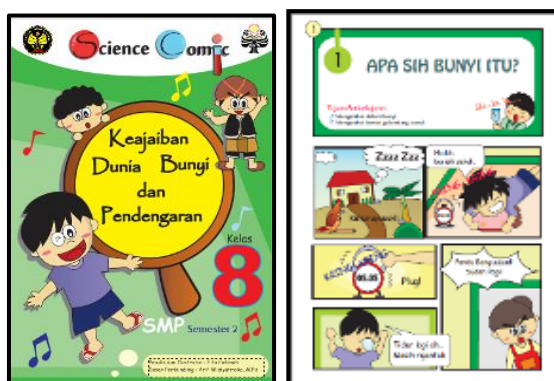
Gambar 1. Tampilan Media Science Comic Berbasis PBL

Media science comic berbasis PBL dinilai oleh pakar untuk mengetahui kelayakan media. Penilaian pakar berdasarkan penilaian BSNP yang dilaksanakan melalui dua tahapan, yaitu tahap I dan tahap II. Penilaian tahap I merupakan penilaian media science comic terhadap kelengkapan komponen isi media science comic . Hasil penilaian tahap I mendapatkan persentase skor 100% positif (sangat layak) terhadap setiap aspek penilaian. Penilaian pada tahap I mendapatkan kategori sangat layak karena dari segi kelayakan isi, cerita pada science comic berbasis PBL sudah sesuai dengan KI, KD, maupun tujuan pembelajaran. Selain itu, unsur-unsur dalam science comic berbasis PBL juga sudah ada dan lengkap. Kualitas kegrafikan media science comic berbasis PBL juga baik, seperti hasil cetak, warna, bentuk dan ukuran science comic berbasis PBL.