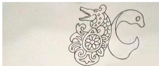
Foto 9. Desain kelat bahu

Berdasarkan Foto 8, terlihat bahwa bentuk kelat bahu menggunakan bentuk kepala naga yang seperti membuka mulutnya dan dihiasi oleh payet-payet. Desain kelat bahu yang dikembangkan oleh pengabdian dan Bembo Craf berbeda dengan bentuk desain kelat bahu yang biasa digunakan, baik dari sisi bahan maupun motif.