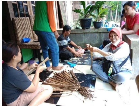
Foto 4. Proses pendampingan oleh pengabdian

Foto 4 menunjukkan bahwa kegiatan pendampingan sedang dilakukan oleh tim pengabdian. Tim pengabdian memberikan pelatihan pembuatan desain busana tari yang digunakan dalam tari tradisional kerakyatan. Desain yang dibuat di dalam kegiatan pendampingan terdiri dari: irah-irahan, sumping, kalung, kelat bahu, sabuk, uncal, boro, samir, binggel, celana, dan baju.