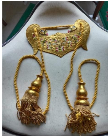
Foto 10. Uncal dalam tari tradisional Klasik

Foto 10 menggambarkan bentuk busana tari yang digunakan dalam tari tradisional klasik yaitu uncal. Terlihat bahwa terdapat dua lubang yang diberi tali kemudian dilengkapi dengan bandul sebagai pemberat. Di bagian bandul juga diberi renda-renda dalam jumlah yang banyak. Bahan dasar pembuatan uncal hampir sama seperti komponen busana yang lain, yaitu kuningan atau kulit.