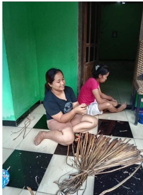
Foto 3. Proses pembuatan desain