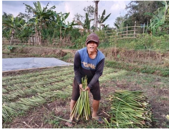
Foto 2. Proses pengeringan enceng gondok