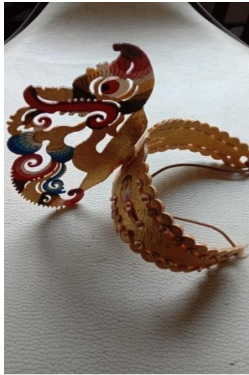
Foto 8. Kelat bahu dalam tari tradisional Klasik