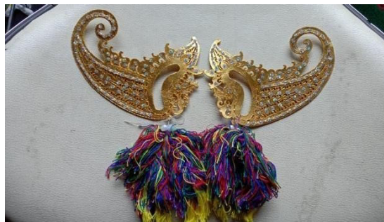
Foto 6. Sumping dalam tari tradisional Klasik