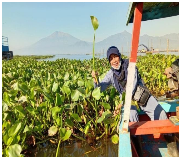
Foto 1. Keberadaan enceng gondok yang melimpah