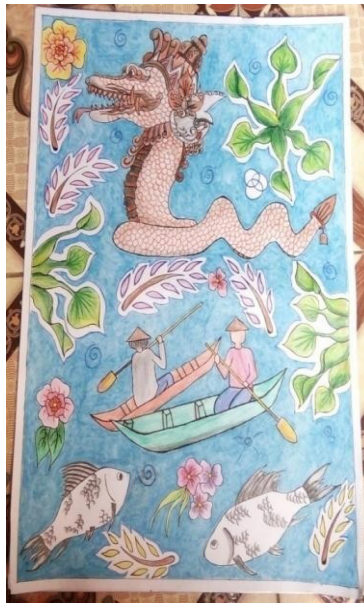
Foto 12. Desain kain

Berdasarkan Foto 12, dapat dijelaskan bahwa desain kain yang akan dibuat sebagai busana tari tradisional kerakyatan adalah menggambarkan ciri khas dari Rawa Pening. Ciri khas terdiri dari seorang anak berwujud naga, yang berada di dalam rawa, terdapat tumbuhan enceng gondok yang tumbuh subur di dalam rawa, ada pula para nelayan dan disertai dengan adanya ikan-ikan yang hidup di rawa. Warna kain yang akan dibuat dalam kegiatan pendampingan bersama Bembo Craf didominasi oleh warna biru muda.