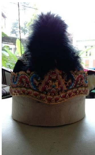
Foto 5. Bentuk irah-irahan dalam tari tradisional

Penyajian tari khususnya tari tradisional terdapat busana yang digunakan di bagian kepala penari disebut irah-irahan. Irah-irahan sebutan bagi penutup kepala, berasal dari Bahasa Jawa “sirah” artinya kepala (Sena Wangi, 1999,649) Irah- irahan berfungsi menutup bagian kepala. Masing-masing tarian pasti menggunakan irah- irahan yang berbeda dan menyesuaikan cerita atau golongan pemakainya. Berikut merupakan salah satu contoh irah-irahan di dalam tari tradisional: