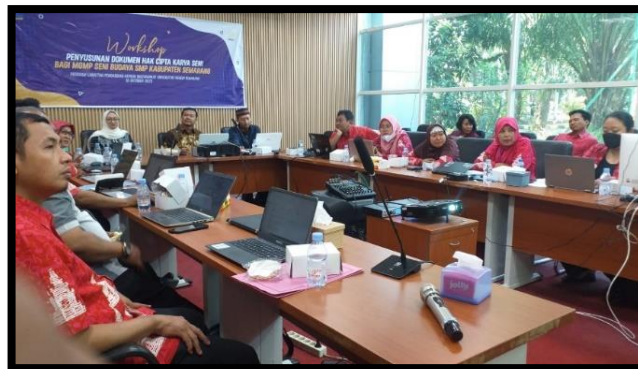
workshop penyusunan dokumen oleh pengabdian UNNES dan mitra MGMP Seni Budaya ( Rabu 18 Oktober 2023)

Workshop Pendokumentasian MGMP dipandu oleh pengabdian bersama-sama membuka alamat link pendaftaran hak cipta yang sudah difasilitasi oleh sentra KI ( Kekayaan Intelektual) Universitas Negeri Semarang. Sebelum pelaksanaan, peserta MGMP sudah siap dengan dokumen kelengkapan yang telah diinstruksikan pada kegiatan sebelumnya. Untuk mempermudah, peserta menggunakan perangkat laptop dalam proses unggah dokumen hak cipta. Peserta dipandu oleh tim pengabdian dengan langkah-langkah sesuai paduan. Adapun dokumen yang harus diunggah meliputi email, jenis ciptaan, file dokumen ciptaan berupa PDF, URL Ciptaan, KTP Pencipta, nama lembaga, alamat lembaga, surat pernyataan keaslian ciptaan bermeterai, surat pengalihan lembaga bermeterai, judul ciptaan, uraian singkat ciptaan, tanggal pertama diumumkan, kota pertama diumumkan, jumlah peserta, nama dan alamat lengkap pencipta.