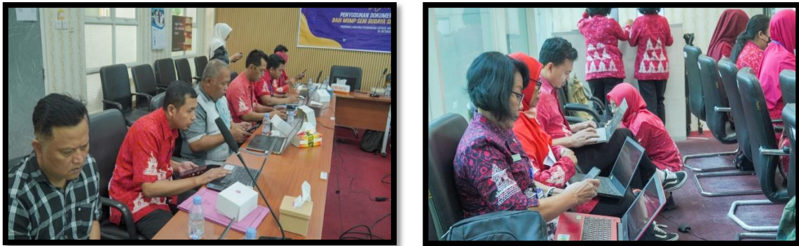
Gambar 5. Proses pengungkahan karya seni secara online oleh MGMP

Dari total 21 guru yang mengikuti kegiatan hingga akhir, diperoleh 19 guru yang telah sukses mendaftarkan karya seni nya. Jenis karya yang berhasil didaftarkan HKI meliputi kategori 1.) Lagu ( Mars,Hymne,dan Jingle) sebanyak 13 HKI 2.) Seni Rupa 2 HKI, 3.) Seni Batik 1 HKI, 4.) Seni Sendra Tari 1 HKI, 5.) Seni Motof 1 HKI, 6.) Seni Logo 1 HKI. Berikut dataya :