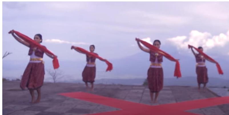
Gambar 8. Karya Tari