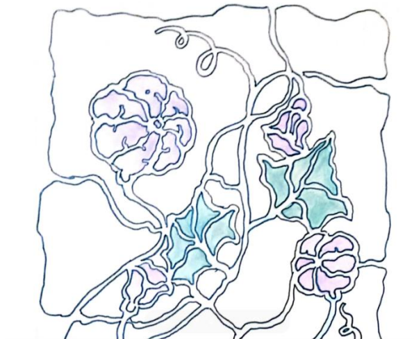
Gambar 6. Contoh Karya Seni Rupa

Berikut contoh sampel karya cipta guru seni budaya :